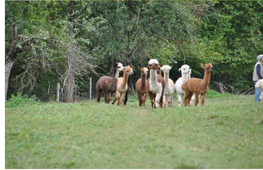
auf dem Alpaccahof