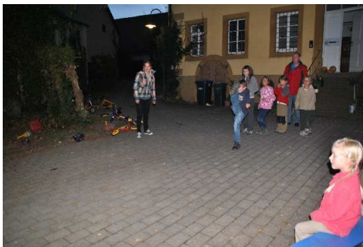
Text und Bilder Karl-Heinz Bantzhaff

Und wieder ging eine gelungene Wanderung zu Ende.