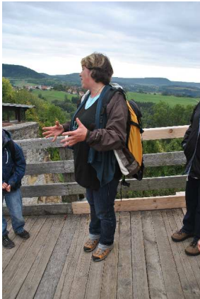
Bei der Führung