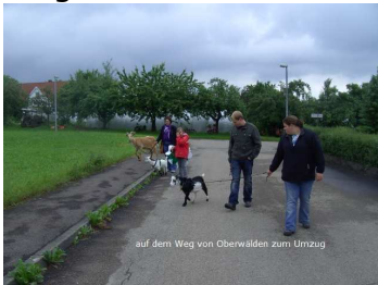
auf dem Weg von Oberwälden zum Umzug