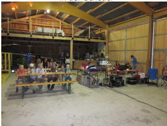
in der Scheuer